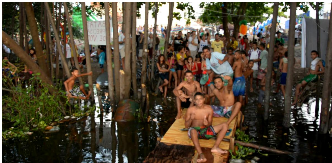
FIGURA 2 – Praias do Capibaribe – Intervenção em Santa Luzia (Maio, 2015).