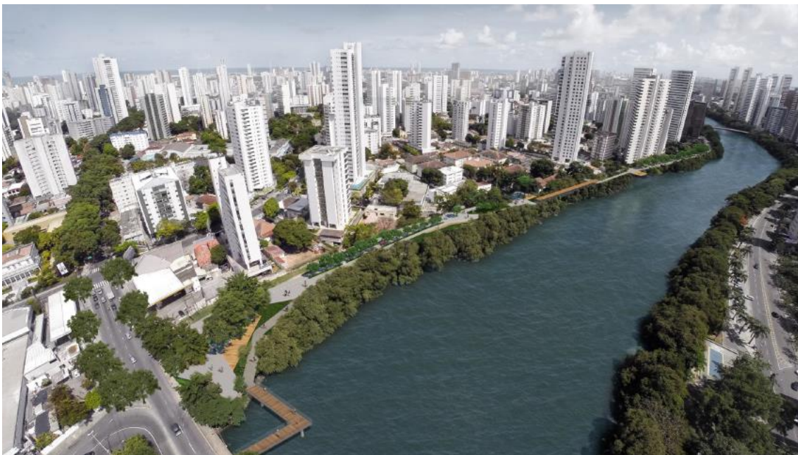
Figura4. - Ilustração da proposta da “Via Parque” apresentada pela equipe do Parque Capibaribe / INCITI / UFPE.