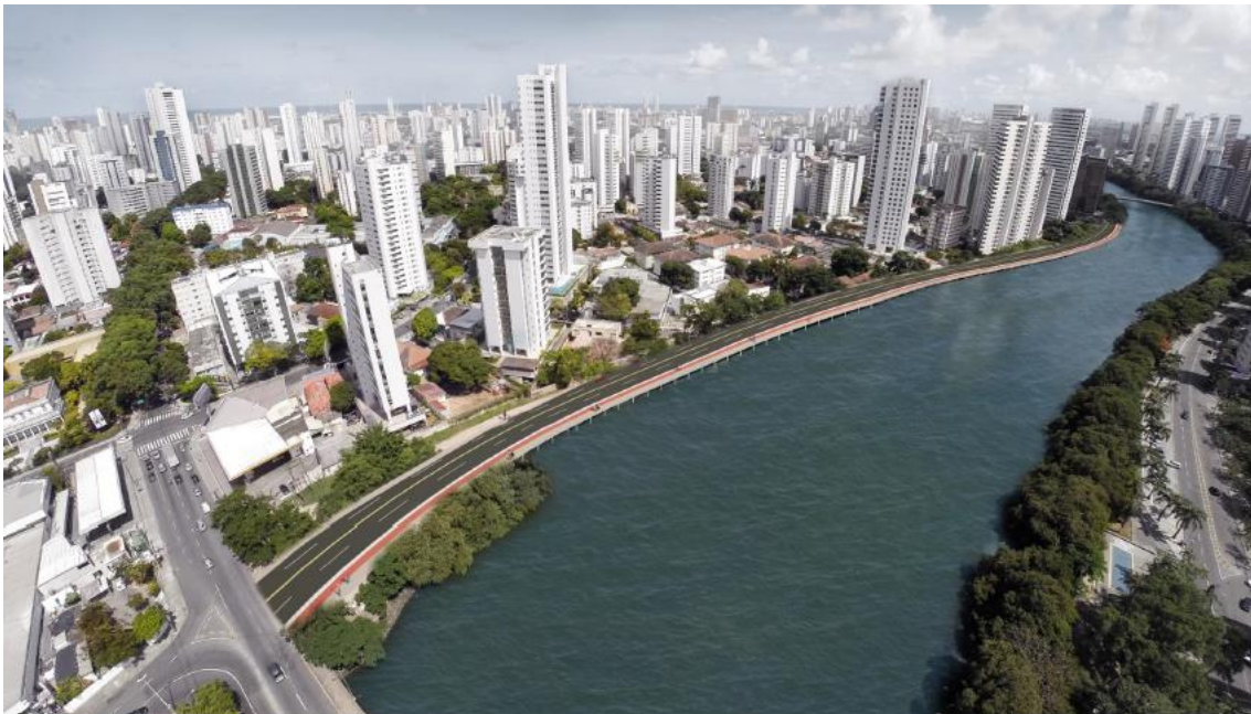
Figura3. - Ilustração da proposta da Avenida Beira Rio apresentada inicialmente pela Prefeitura do Recife.