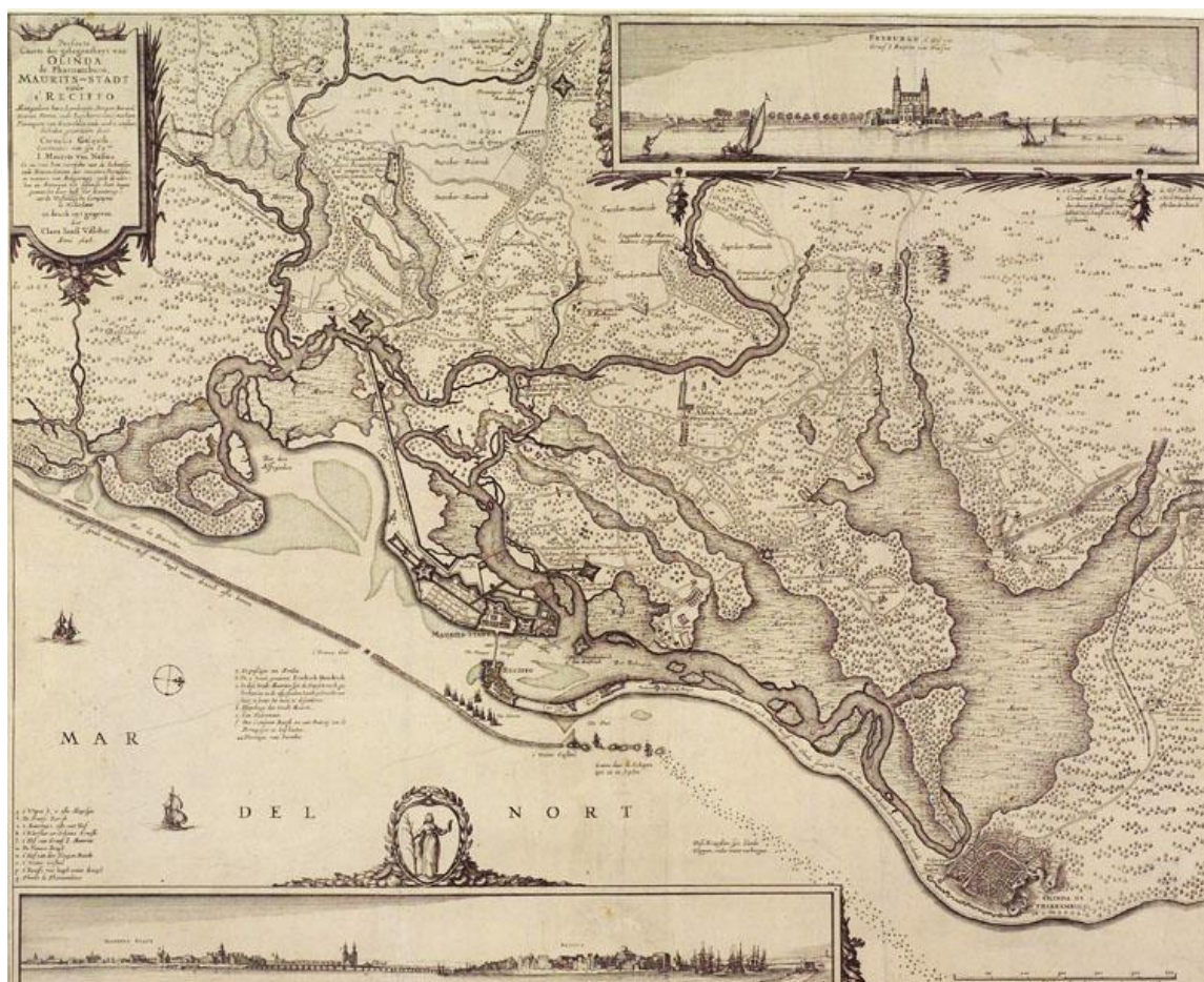
Figura 1. Mapas de Recife e Olinda elaborado por Cornelis de Goliath (1648) (Het Scheepvaartmuseum, Amsterdam).

A malha urbana recifense se expandiu sobre a planície alagada na foz do Capibaribe, condicionada pelo enfrentamento/adaptação aos corpos d’água (Figura 1). Amorim e Loureiro (2000) utilizaram ferramentas da sintaxe espacial (HILLIER, 1984) para analisar mapas históricos do Recife. Neste estudo, observa-se que as linhas mais integradas do tecido urbano se voltavam às margens do estuário, sendo a conexão da rede fluvial com o tecido urbano incontestável na gênese morfológica do Recife.